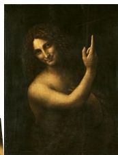
『洗礼者聖ヨハネ』、 1514年頃、ルーヴル美 術館 (パリ)。

日が射している明の所の天使の右手は洗礼者ヨハネの右手となって、何かを意味ありげに指している。本当のところは、聖母マリアの背後に潜む者を指しているのではないか。幼いヨハネは後の洗礼者ヨハネと同様に天を指す。そして、聖母マリアの左手は、それらの手を遮る形にある。