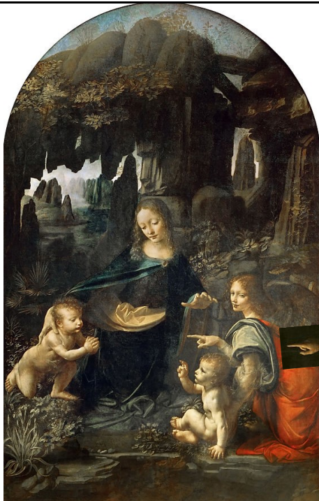
『岩窟の聖母』、 1483年 - 1486年、 ルーヴル美術館 (パリ)。