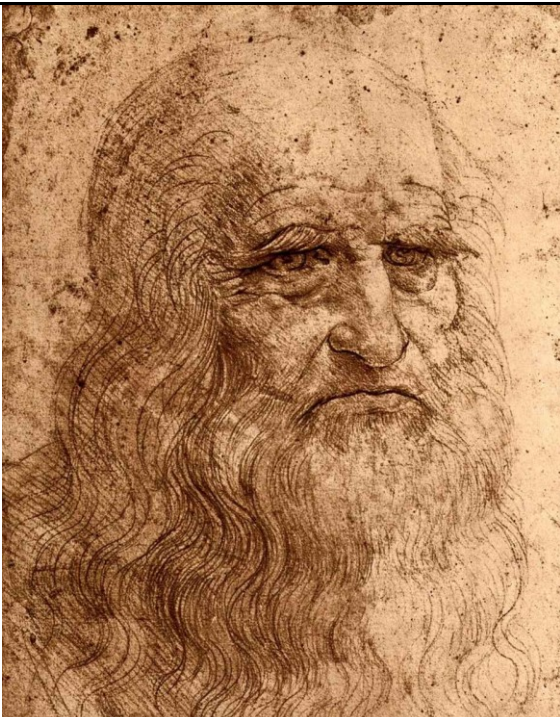
レオナルド・ダビンチ Leonardo da Vinci